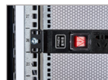
Perfil de montaje galvanizado