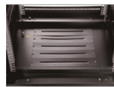
Entrada de cables en el panel trasero