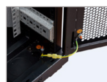
Cable para tierra incluido