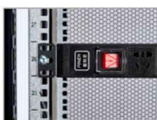
Perfil de montaje galvanizado