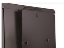
Paneles laterales extraíbles