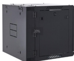
Entrada de cables en el panel trasero