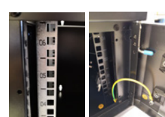
Perfil de montaje galvanizado con marca U