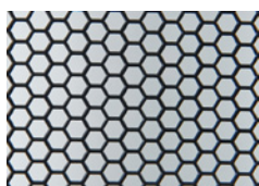
Puerta trasera de malla de alta densidad