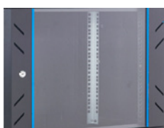
La puerta de cristal con franjas azules.