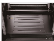
Entrada de cables en el panel trasero