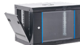
Paneles laterales extraíbles