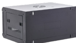
Orificios para montaje en pared