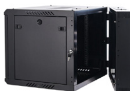
Panel abatible con cerradura redonda