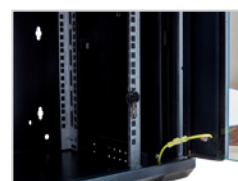
Perfil de montaje galvanizado