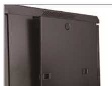
Paneles laterales extraíbles