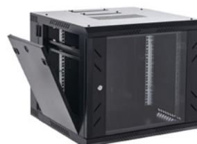
Paneles laterales extraíbles