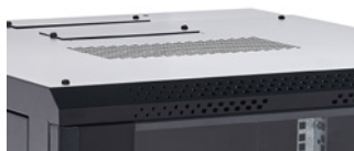
Orificio de escape del ventilador