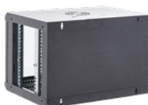
Entrada de cables en el panel trasero