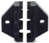
Matriz de repuesto para CRIMPFOX 25R

Matriz de repuesto - CRIMPFOX 25R/DIE - 1212040